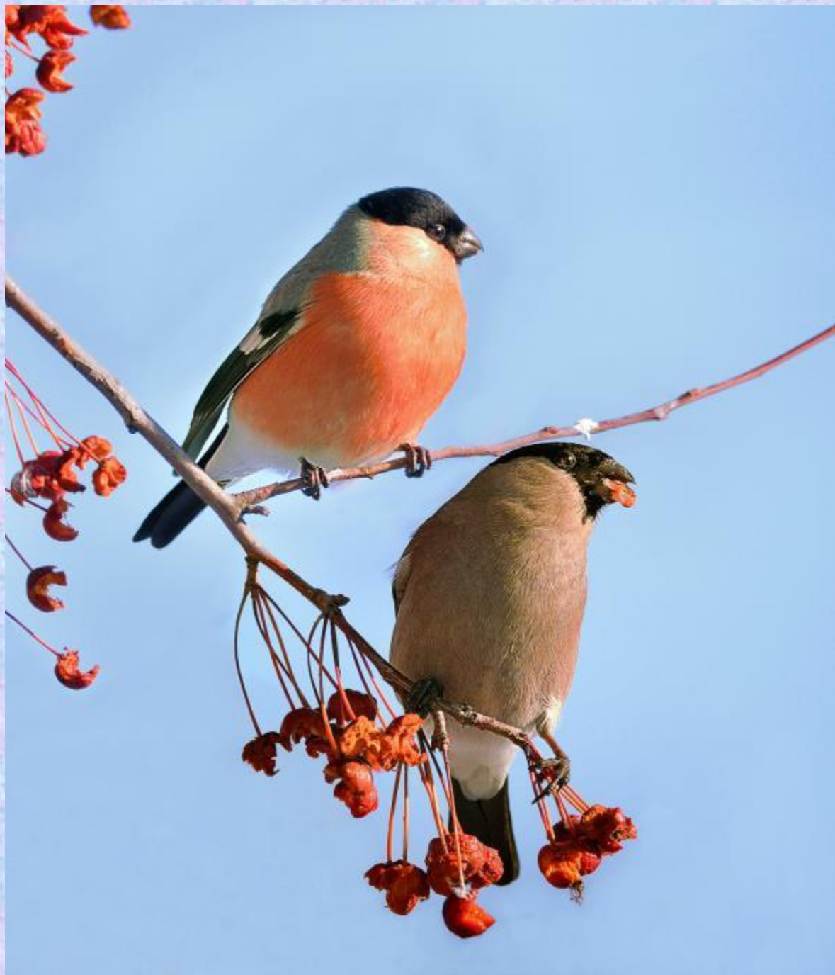
Самец и самка снегиря